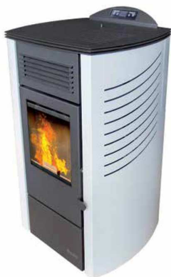
Salida de humos: posterior (T90) Colores: blanco y negro